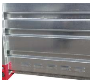
Grilles d'aérations basses