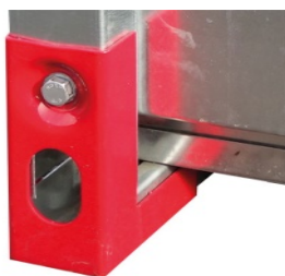
Point d'ancrage (fixation du câble)